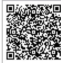
↑サステナビリティ経営方針 (京都銀行 HP)

京都銀行・京都総研コンサルティングのご担当者様が専用のツールを用いてイクロスとの複数回のディスカッションを通じて、SDGs・ESGの観点から分析を行い、企業理念や経営者の思いを踏まえながら、マテリアリティの特定と方針の策定をして頂き、サステナビリティ経営方針がこの度、完成致しました。このサステナビリティ経営方針は、単なる社会的責任の達成にとどまらず、弊社の持続可能な成長戦略の核心部分です。私たちは、これを通じて業界に新たな基準を設け、社会全体の変革を牽引していくことを目指しています。