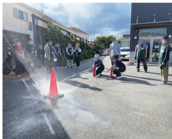
消火器をいざ使用