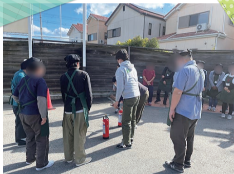
消火器の使用方法を説明